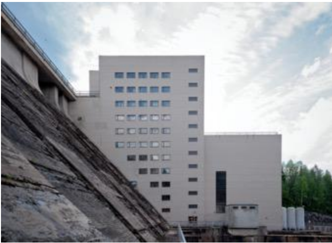
Pyhäkosken voimalaitos 2019