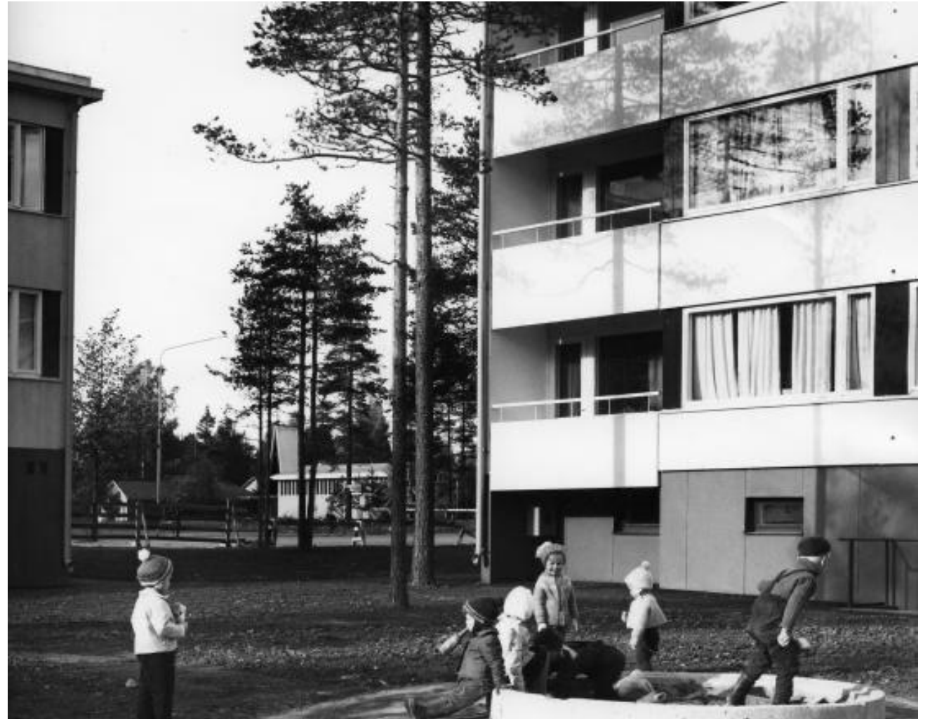
Jalmari Aarnio Hyvinkään kaupunginmuseon valokuvakokoelma